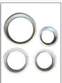
Alu alloy rims protection rings 铝合金轮胎保护圈