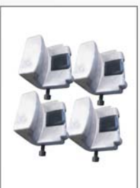
Alu alloy rims protection set 铝合金轮胎保护套