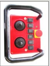
Wireless Remote Control Unit OPTIONAL 遥控可选