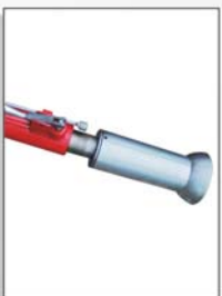
Tubeless roller 真空胎压滚